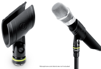
Microphone and stand are not included